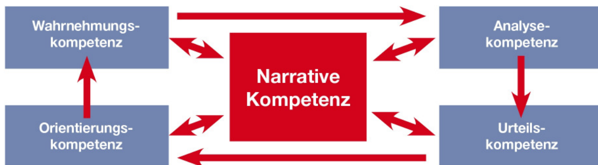
Abb. 3: Kompetenzen im Fach Geschichte

Die „Orientierungskompetenz für Zeiterfahrung“ beschreibt die Fähigkeit, in der Beschäftigung mit Geschichte einen Sinn für das eigene Weltverständnis zu sehen. Sie beruht auf dem Zusammenhang zwischen Gegenwärtigem und Vergangenem und verhilft dazu, den Einfluss historischer Zusammenhänge auf die Gegenwart, auf aktuelle Ereignisse und Entwicklungen zu erklären. Sie befähigt zur Einordnung von Faktenbeständen sowohl in einen thematischen bzw. sachlich-analytischen als auch in einen chronologischen Zusammenhang. Geschichte kann als notwendiges Instrument erkannt werden, um die historische Bedingtheit gegenwärtiger Sachverhalte und Phänomene zu verstehen und die eigene Lebenswirklichkeit zu erklären. Sie ermöglicht es, das eigene Tun und Lassen plausibler zu begründen. Außerdem verhilft sie dazu, in aktuellen Diskussionen die eigenen Einstellungen, Vorurteile, Haltungen, Deutungsmuster und Wertmaßstäbe in den Geschichtsunterricht einzubringen, diese zu reflektieren und kritisch zu hinterfragen. Aus der Kenntnis von Zwängen und Freiheiten, denen historische Entscheidungen unterlagen, können Handlungsspielräume für die Bewältigung der Gegenwart und die Gestaltung der Zukunft benannt werden. Somit verhilft die Orientierungskompetenz letztlich zu ethisch verantwortlichem Handeln. Diese Kompetenz führt zu eigenen Werturteilen.