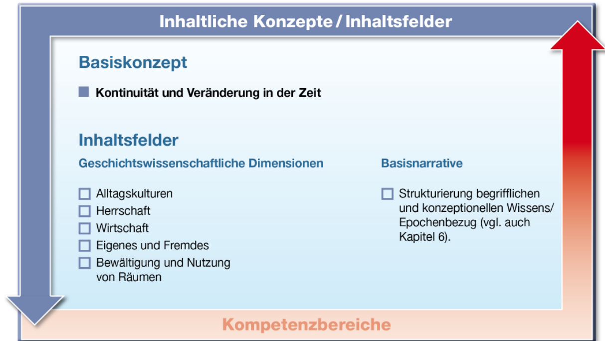
Abb. 4: Basiskonzept und Inhaltsfelder

Das Basiskonzept und die Inhaltsfelder helfen den Lernenden dabei, sich im Universum der Geschichte zurechtzufinden, damit sie die historischen Kompetenzen ausbilden können. Außerdem können diese Zugriffsweisen bei der Erstellung von Schulcurricula und der Generierung von Unterrichtsthemen dienen.